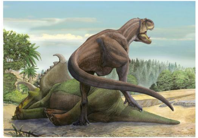
Teratophoneus curriei and Kosmocerotops richardsoni Teratophoneus proclaims on its prey Kosmocerotops , so that other predators are not entered into its territory.