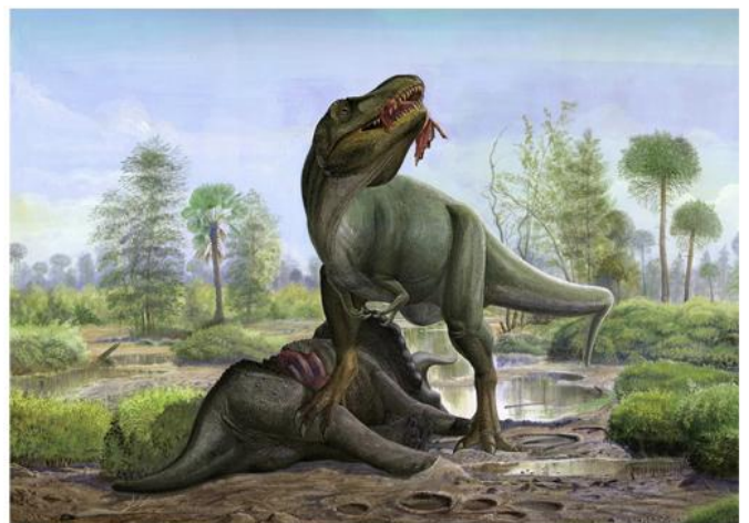
Tyrannosaurus rex and Triceratops prorsus

Female and male Concavenator during mating courtship. Female (right) examines decorated hump male (left). Their ceremony prevents group Aragosaurus go to the watering.